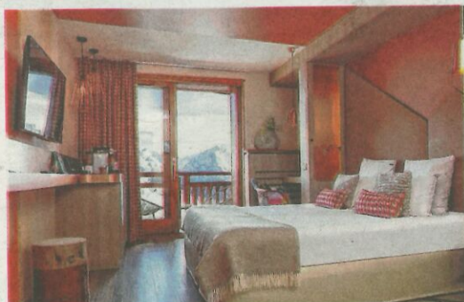
In hotel Les Grandes Rousses is het gezellig logeren.

Voor wie het allemaal iets minder schaapachtig mag, heeft Alpe d'Huez gelukkig