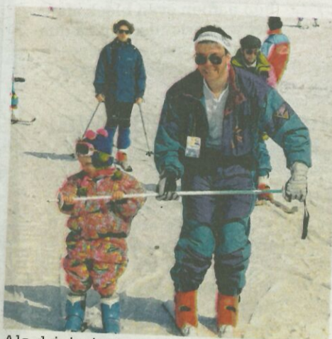
Als driejarige ging het nog niet helemaal van harte ...

O ef. De enge beer die vroeger aan de ingang van de Jardin des Neiges stond is verdwenen. In de plaats aalbare boerderijdiertjes. Ik speur naar wenende kleutertjes. Een betuurd gezichtje, tot daar, maar géén tranen. En al helemaal niemand die hysterisch om z'n mama schreeuwt terwijl hij of zij zich optrekt aan een parcours met touwen. Was ik vroeger dan zo'n flauw kind? "De tijden zijn wel veranderd hoor", stellen de monitors van de Ecole du ski français (ESF) mij gerust. "Het is allemaal wat gemoedelijker en meer op maat van het kind." Ploegen tussen de varkentjes of schaapjes: het is inderdaad wat anders dan saai hoepels of dus die enge beer. Kinderen zijn onderaan in Alpe d'Huez baas met rollende tapijten als lift en "ludieke pistes". "Die lokken véél volk", klinkt het. Marcel's Farm, Chez Roger en Jacques le Bucheron zijn inderdaad niet alleen populair bij het jonge grut. Zelfs als ervaren skiër is het bijzonder geestig om op die groene piste een mini half pipe te doen, door een tunneltje en over een brugje te knallen. Op-