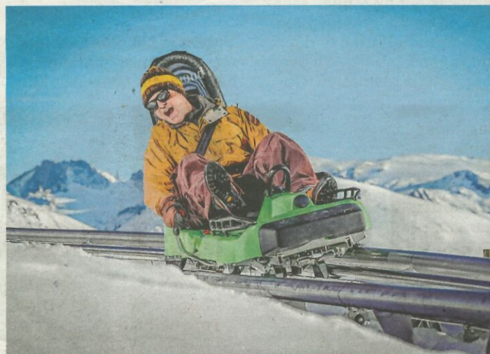
Niet voor gevoelige magen, een rodelritje.