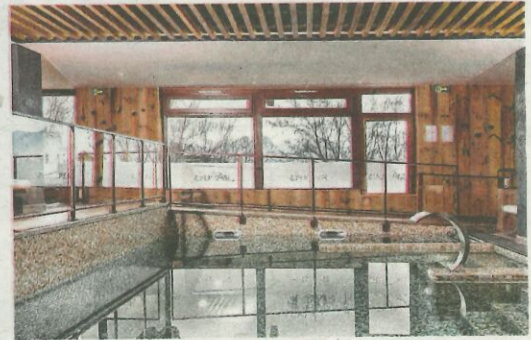
Na de inspanning voelt een uurtje wellness zalig.