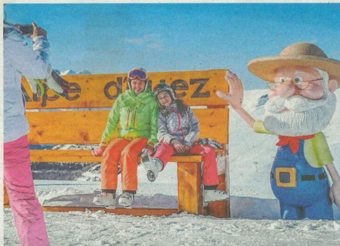
Alpe d'Huez en Vaujany zetten zwaar in op kindvriendelijkheid.

masseuse mijn kuiten bewerkt. Zo goed. Die vervelende skibotten, dan toch? In elk geval: ik heb alweer zin om ze opnieuw aan te trekken.