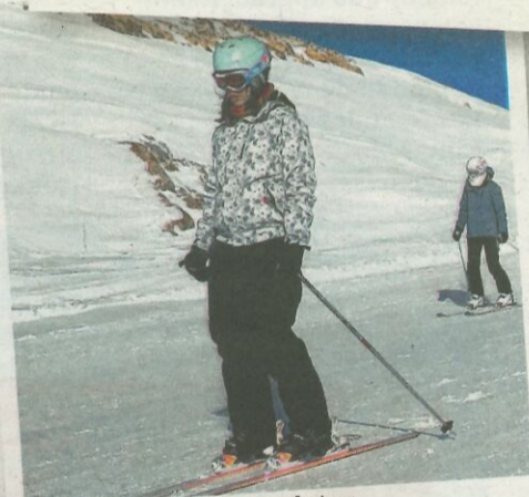
... maar zoveel jaren later is skiën pure fun.

ook wat anders te bieden. Het pistepan is niet van die aard dat je het even uitvouwt op je nachtkastje. 250 km, op 10.000 hectare, van 3.300 meter op de top tot 1.135 meter op het laagste punt. Eerlijk? Da's niet helemaal behapbaar. Zelf je skidag goed plannen is moeilijker én makkelijker met zo'n aanbod. "Je kunt blijven skiën zonder vaak op dezelfde punten uit te komen", aldus monitor Christophe Riu. "Maar er zijn grote verschillen in de condities van de piste, afhankelijk van op welk moment van de dag je ze neemt, en natuurlijk het weer." Alpe d'Huez wordt ook wel "het eiland in de zon" genoemd, omdat de meeste pistes zuidelijk liggen. Fijn voor zonnekloppers, maar later op het seizoen heeft dat wel zo zijn effect op de sneeuwkwiteit. Aan het begin van de week investeren in een