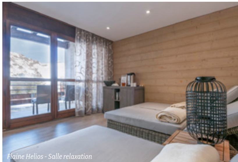
Flaine Helios - Salle relaxation

Ce label apporte une belle image auprès de nos clients et de nos partenaires hôteliers qui eux aussi se consacrent à des labels de qualité dans leur domaine.