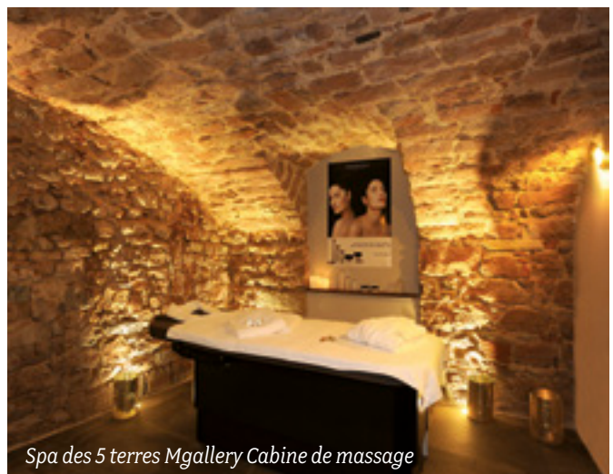
Spa des 5 terres Mgallery Cabine de massage

Notre équipe a pris cette décision comme un challenge. Notre objectif était de tester notre niveau mais aussi de déterminer les pistes d'amélioration afin de proposer les meilleures prestations à nos clients. 💧