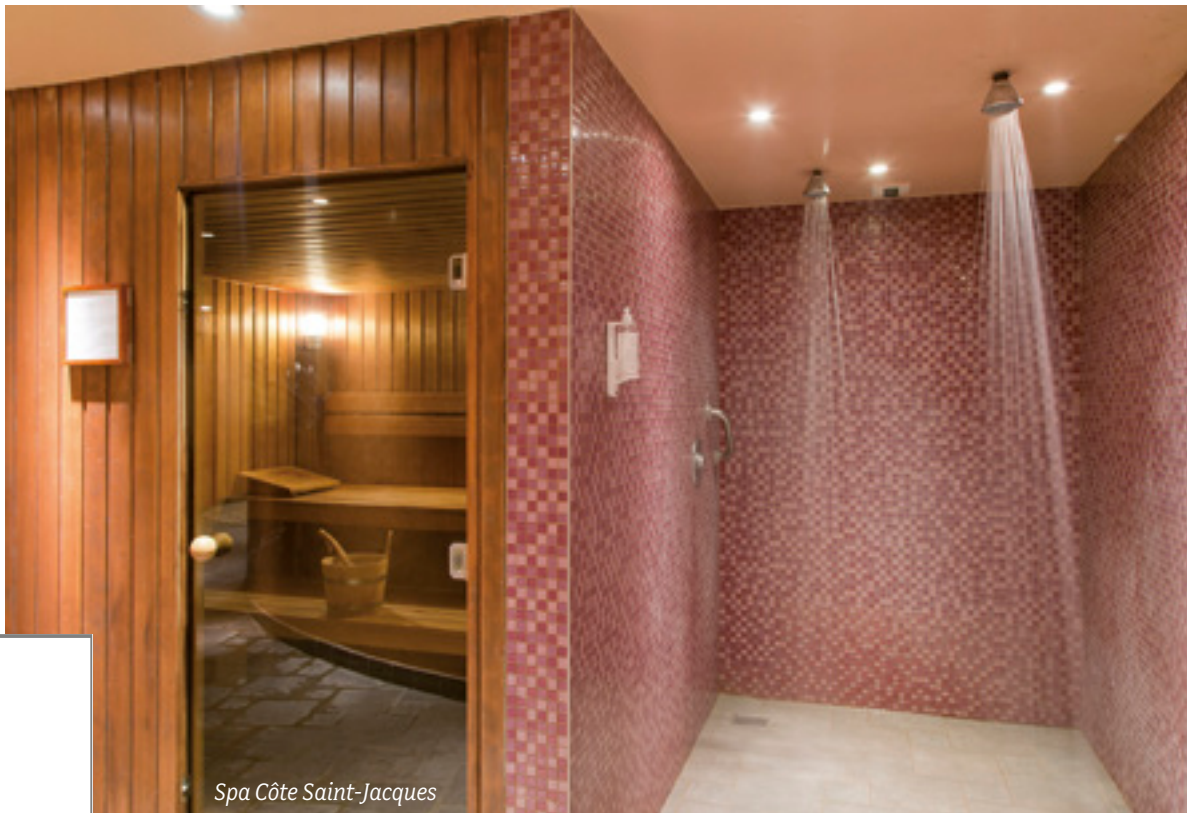
Spa Côte Saint-Jacques