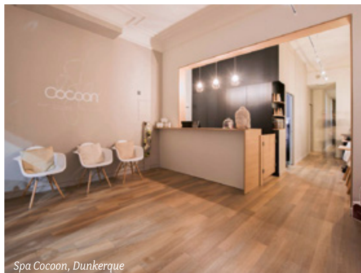
Spa Cocoon, Dunkerque

Un mot suffit pour nous décrire : authenticité. Tout ce que l'on entreprend est fait avec cœur et passion. Nous mettons un point d'honneur à conserver le côté humain envers notre clientèle et au sein de l'équipe.