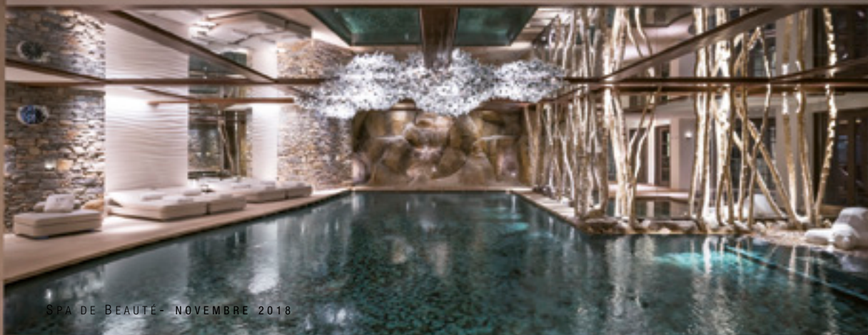
Cheval blanc Indoor Pool - F. Nannini

En quête perpétuelle d'excellence, nous avons besoin du retour des professionnels de la beauté et du bien-être pour nous aider à nous remettre en question et nous sublimer. C'est aussi une belle récompense pour les équipes qui opèrent le spa et s'investissent à 100 % pour offrir des expériences uniques à nos hôtes.