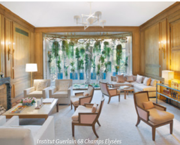
Institut Guerlain 68 Champs Elysées