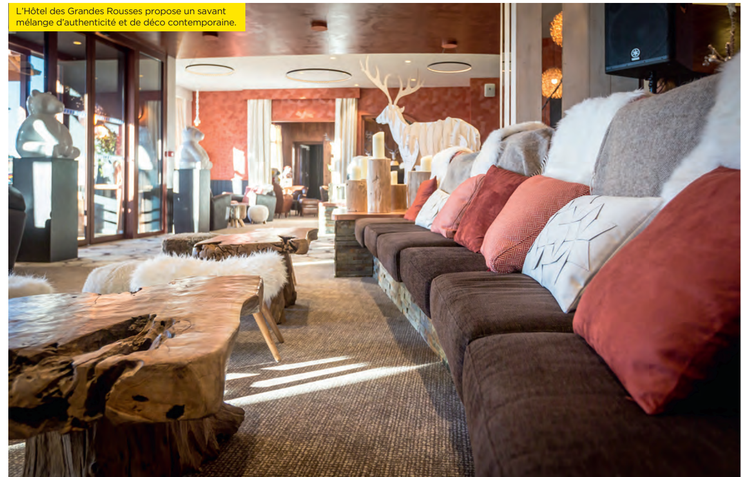
L'Hôtel des Grandes Rousses propose un savant mélange d'authenticité et de déco contemporaine.