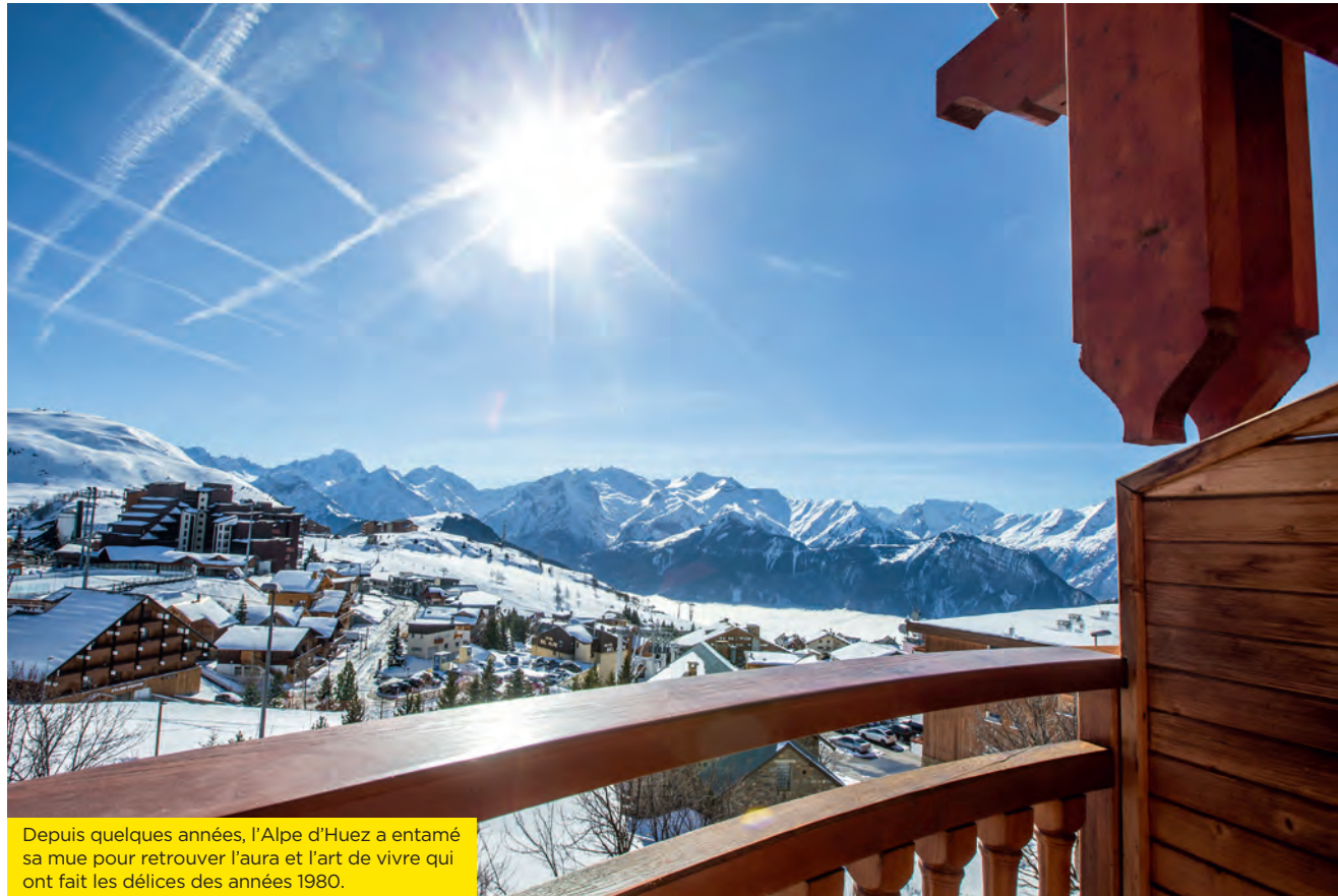
Depuis quelques années, l'Alpe d'Huez a entamé sa mue pour retrouver l'aura et l'art de vivre qui ont fait les délices des années 1980.