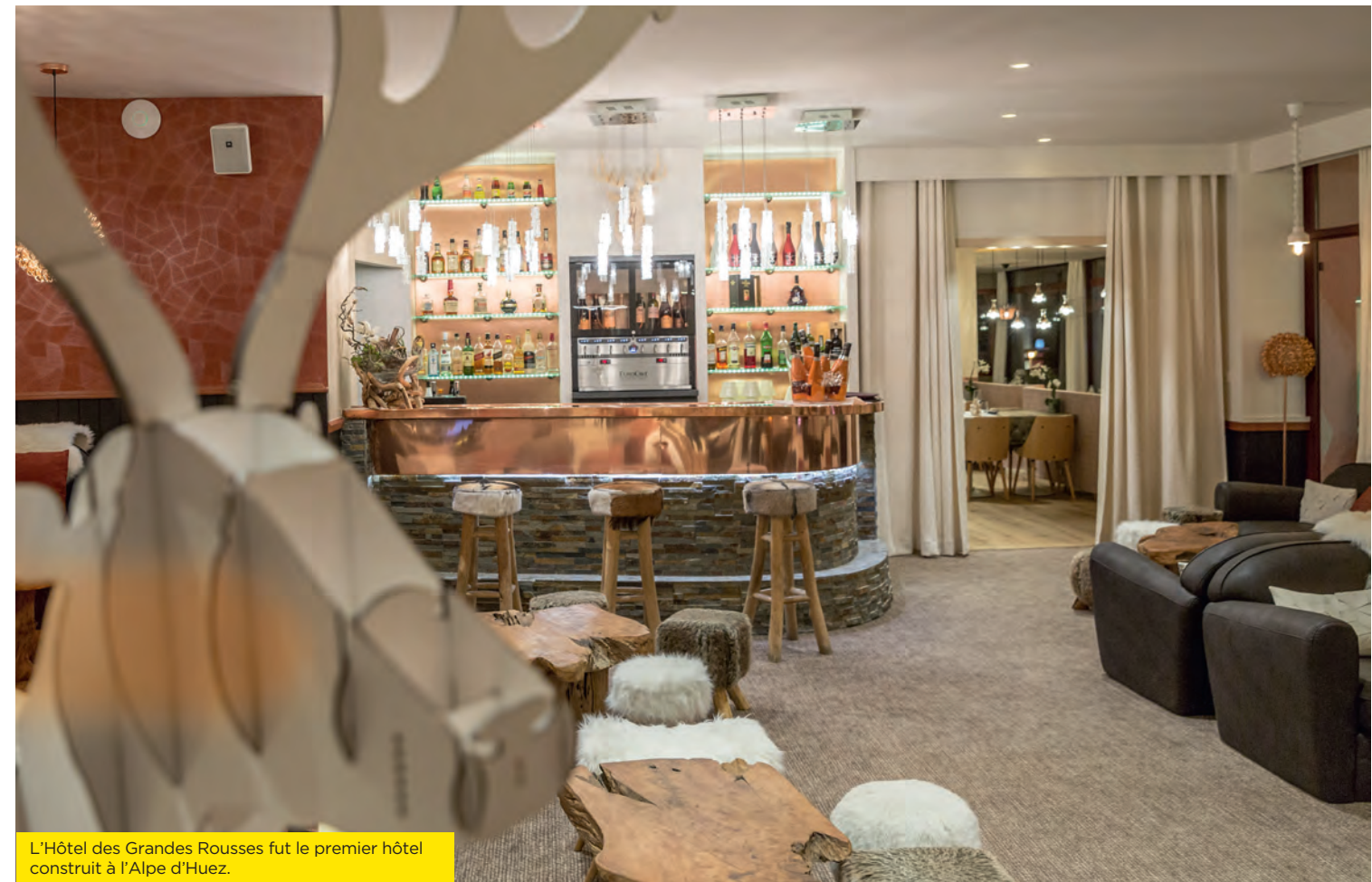
L'Hôtel des Grandes Rousses fut le premier hôtel construit à l'Alpe d'Huez.

2021 : liaison des stations de l'Alpe d'Huez et des Deux Alpes à 2100 mètres d'altitude.