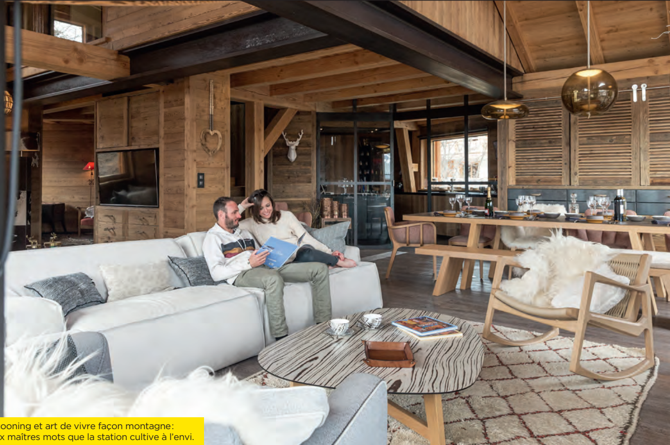
Cocooning et art de vivre façon montagne: deux maîtres mots que la station cultive à l'envi.

par faire perdre à la station un peu de la sienne. L'Alpe perd en gamme et des hôtels mythiques comme La Ménandière et le Grand hôtel ferment.