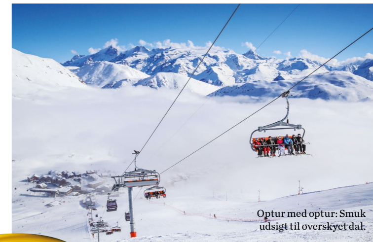
Optur med optur: Smuk udsigt til overskyet dal.