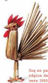
Coq en paille, Suède, région de la Dalie, vers 1950-1960.

Dans cet élan de reconnexion avec la nature que l'urgence écologique impose, quelques rares humains ont déjà amorcé le mouvement vers d'heureux compagnonnages avec mammifères, plantes, insectes... Dans « Être(s) ensemble », exposition inspirée par les écrits de Bruno Latour, en particulier Où atterrir? dans lequel le sociologue enjoint de pratiquer une observation mobilisant tous les sens, ou encore par l'écologue américain Aldo Leopold, le Musée d'ethnographie de Genève examine et met en scène des modes de vie plus justes et respectueux de la planète. Chacune des œuvres et pièces de cette expo drôlement bien faite (du propos à son écoconception) nous y invite. Jusqu'au 7 janvier 2024. meg.ch